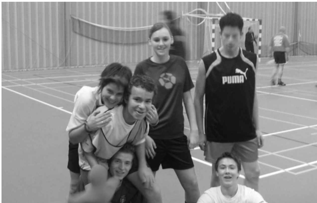
Het winnende team bij de B-junioren

Op zaterdag 7 januari vond het jaarlijkse zaalvoetbaltoernooi weer plaats in de Hontenissehal te Kloosterzande. Samen met de papa's en mama's en broertjes en zusjes werd er de hele dag gevoetbald.